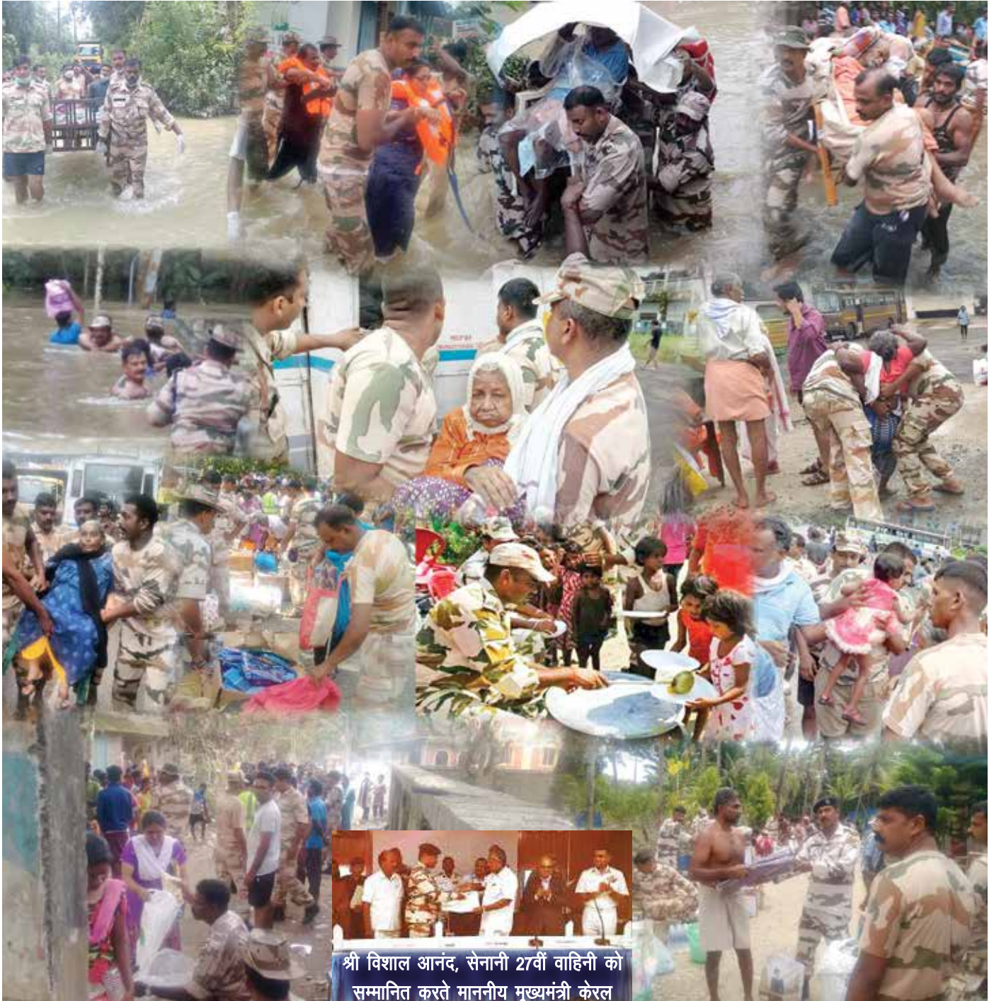
श्री विशाल आनंद, सेनानी 27वीं वाहिनी को सम्मानित करते माननीय मुख्यमंत्री केरल

वाहिनी ने स्थानीय जनता को मेडिकल सुविधा उपलब्ध करवाई और उन्हें निशुल्क दवाएं वितरित की गईं। इस दौरान चोटिल हुए 1725 लोगों को फर्स्ट एड दिया गया। लगभग 15 दिनों तक चले राहत अभियान के दौरान लगभग 17000 लोगों को राहत सामग्री का वितरण भी किया गया।